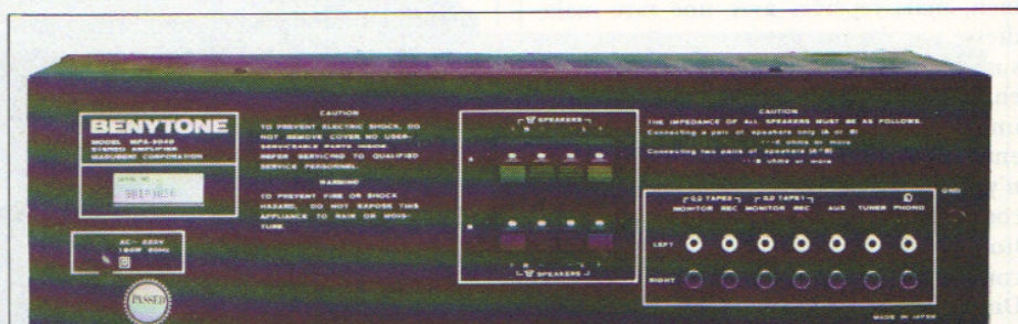
Une face arrière qui ne pose guère de problèmes, hormis celui de l'absence d'une prise Din pour enregistreur.

présentes ne passent pas avec autant de propreté qu'on pourrait le souhaiter. Synthétiquement, l'écoute reste agréable, ne provoquant pas de fatigue, bien qu'elle soit légèrement empâtée — sans aller jusqu'à parler toutefois de confusion, ne me faites pas dire ce que je ne pense pas. La puissance délivrée se situe nettement au-dessus de celle promise par le constructeur dans ses spécifications et doit permettre d'agiter les plus rétives membranes, entendez par là celles d'enceintes à faible rendement, comme il en fleurit chaque jour davantage, portées par la vague de miniaturisation actuelle. Ce petit ampli, dont le nom devrait résonner agréablement aux oreilles des plus mystiques de nos lecteurs par la religiosité non dissimulée qu'il évoque, est d'un rapport qualité/prix finalement acceptable compte tenu de ses agréments manipulateurs ; mais, à cause des petites imperfections de son écoute, il ne réussit pas à se hisser vers les sommets de la compétition présente et se situe plutôt dans ce qu'il est convenu d'appeler une convenable moyenne. Il serait intéressant de se pencher sur ce qu'était cette moyenne qualitative il y a cinq ou dix ans et d'effectuer les comparaisons qui s'imposent : en quel sens est allé le progrès ?