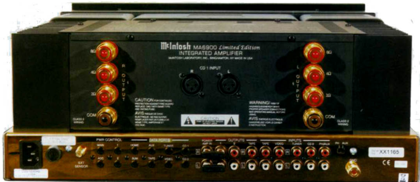
La parata delle connessioni. In questa versione sono implementati i connettori della serie 2K. Telaio dorato.